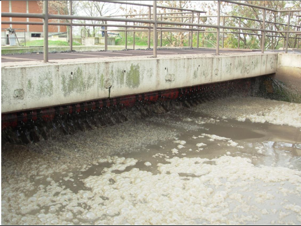
Слика 2. Фотографија једног мамут ротора (од 4 укупно)