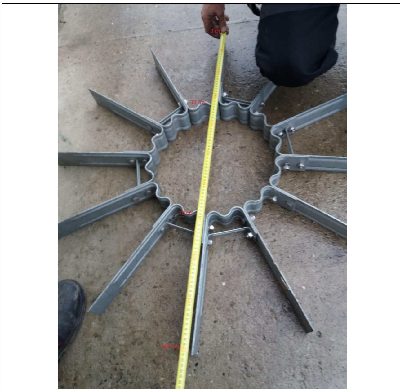
Слика 1. Фотографија склопа једног сета лопатица (пречник око 100 cm)

Један сет се састоји од 12 лопатица и 6 пречки, међусобно повезаних у функционалан склоп прохромским вијцима М10 и навртком са пластичним осигурачем, као што је приказано на слици :