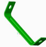
Слика 4. Изглед пречке