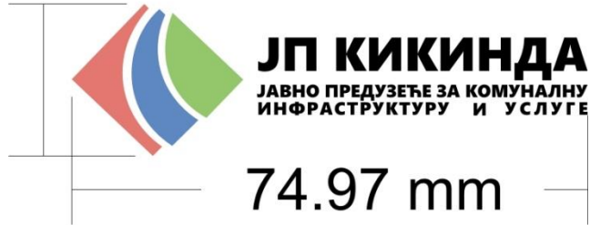
Слика 1. Меморандум за беле картонске фасциле.