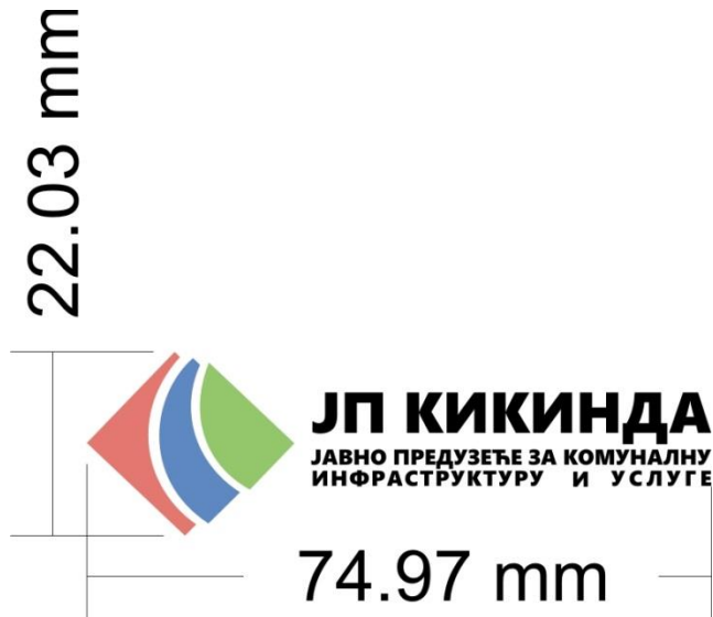
Слика 1. Меморандум за беле картонске фасциле.